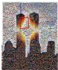
image constituée de portraits de victimes