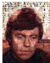
Luc Skywalker réalisé à partir d'images du film Star wars