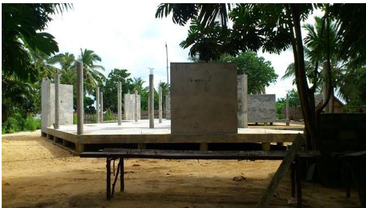
Le bâtiment en cours de construction (juin 2012)

Puisque nous avons transféré sur Ambodifotatra l'activité médicale, nous allons utiliser le bâtiment en cours de construction comme moteur financier en y réalisant une première version, allégée, du projet écologie. Nous allons y aménager cinq appartements qui seront loués à la semaine ou à la nuit aux touristes et qui pourront servir de logement aux médecins ou personnel médical de passage.