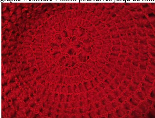
Intérieur de la perruque finie

Si vous souhaitez porter votre perruque avec un chapeau, vous pouvez en rester là et passer directement au paragraphe « coiffure » sinon poursuivez jusqu'au sommet de la tête.