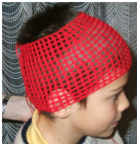
Essayages en cours de réalisation