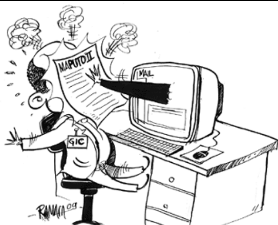
05/09/09 Dans un e-mail adressé aux négociateurs du GIC, Andry Rajoelina tourne le dos à Maputo et confirme son intention de diriger la nouvelle Transition