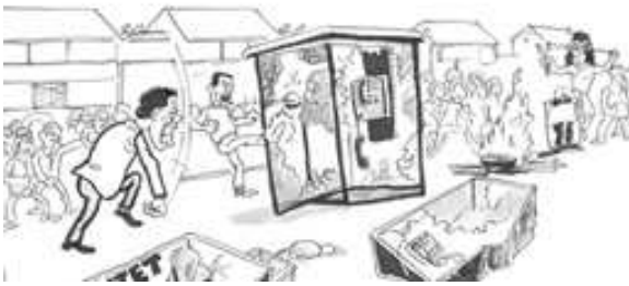
12/09/09 La capitale à nouveau victime de casseurs, échec de la tentative de manifestation des anti-HAT