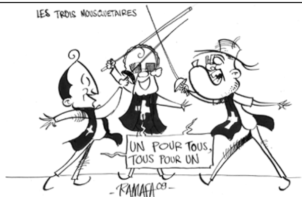
15/09/09 Les 3 mouvances anti-HAT décident de fusionner