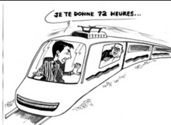
05/09/09 Sans renoncer à sa décision de diriger seul la nouvelle Transition, Andry TGV demande à son Premier ministre de composer un gouvernement plus consensuel sous 72 heures