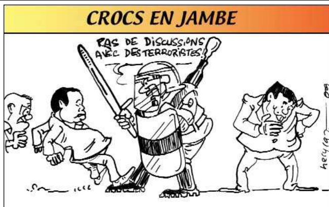
14/09/09 La FIS s'impose face aux 3 mouvances qui tentent de se coordonner pour faire front à la HAT