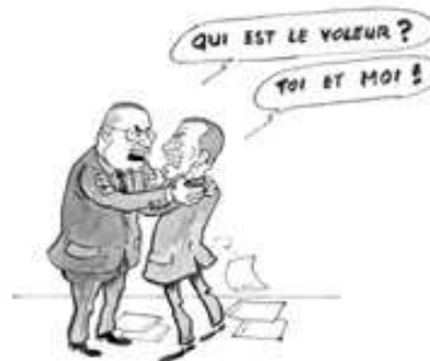
03/09/09 L'affaire de l'achat du riz de Tiko éclabousse les dirigeants de la Transition qui se s'accusent mutuellement de trafics