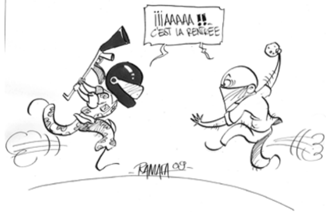
12/09/09 La capitale à nouveau victime de casseurs