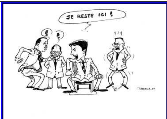
03/09/09 Andry Rajoelina refuse de remettre en cause « sa » Transition

Sources : La Vérité (Ndriana), L'Express (Elisé), Midi (Tchin-Tchin), Les Nouvelles (Ramafa), Courrier de Madagascar (Crocs en jambe/Heryraz)