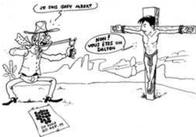
14/09/09 Albert Zafy prend la tête de l'opposition à Andry Rajoelina. Les 3 mouvances anti-HAT décident de fusionner et déposent un ultimatum au chef de la Transition.