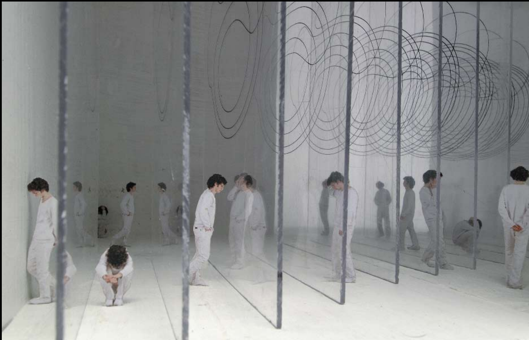
Joël Curtz Le nudo hereditario Fotografía numérica 2006