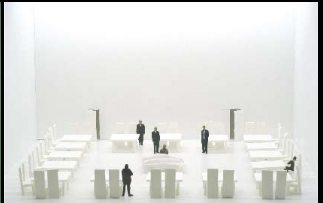
Joël Curtz Le prince contraint d'Henri Michaux Fotografia numérica 2006