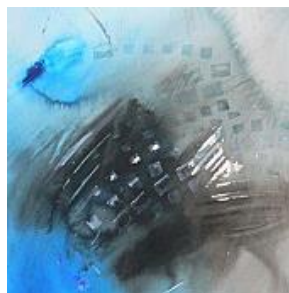
Danielle Volle Finessi