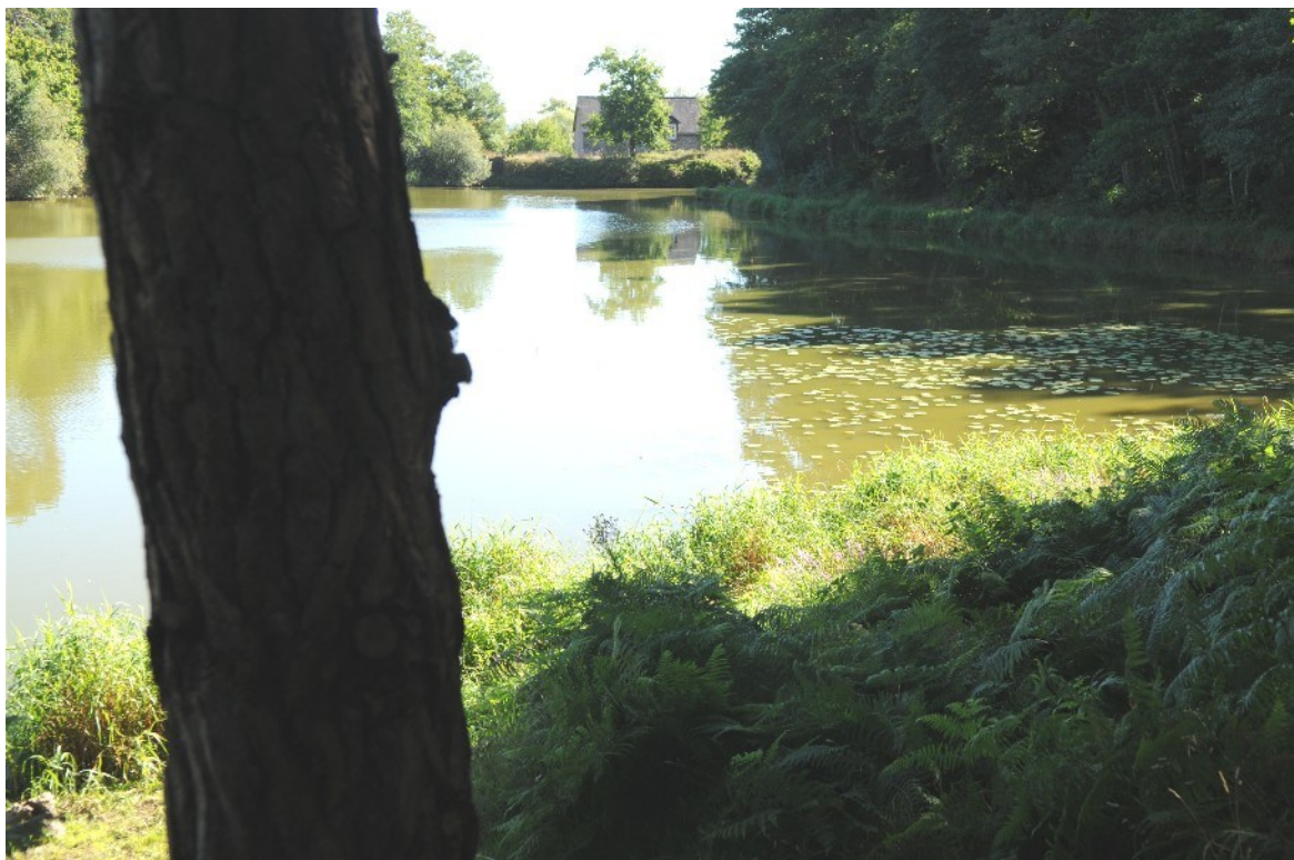
Etang de l'Etunel, rive Ouest au 1er plan, rive sud à droite et rive Est dans le fond. On aperçoit le moulin.