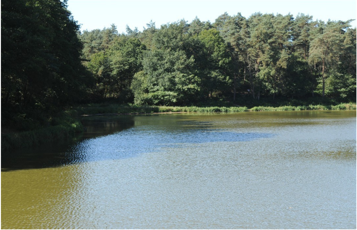
Etang de l'Etunel, rive Ouest dans le fond.