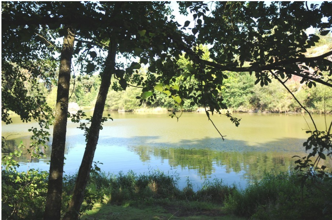
Etang de l'Etunel, rive Sud au 1er plan et rive Nord dans le fond.