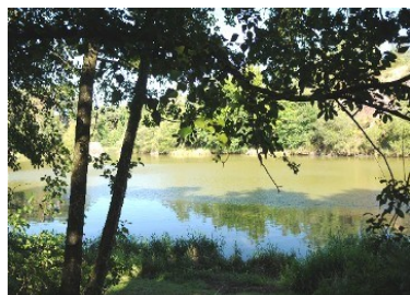
Etang de l'Etunel