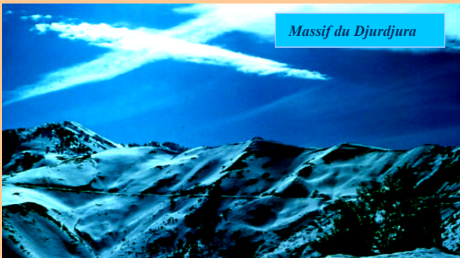
Massif du Djurdjura

Située au Nord de l'Afrique, au cœur du Maghreb, l'Algérie est le deuxième pays du continent par sa taille, après le Soudan. Bordé par le Maroc à l'Ouest et la Tunisie à l'Est, le pays partage aussi des frontières communes avec la Libye au Sud-est, le Sahara Occidental et la Mauritanie au Sud-ouest, le Mali et le Niger au Sud. Au Nord, la Méditerranée baigne sur un littoral de 1200 km. La majeure partie du pays (85%) appartient en fait au Sahara. L'Algérie est une terre de contrastes où les caractéristiques géographiques et climatiques sont très différentes d'une région à une autre. L'étendue du territoire peut se résumer à quatre grandes régions naturelles qui se succèdent du Nord au Sud par :