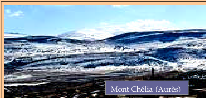
Mont Chélia (Aurès)

Une suite de plaines et de Hauts plateaux situés entre l'Atlas Tellien et l'Atlas Saharien, larges de 200 km, hauts de 1000 à 1200 m, se rétrécissent vers la dépression du Hodna (400 m). Les hauts plateaux de Sétif ; les hautes plaines de Constantine traversées par le Rummel.