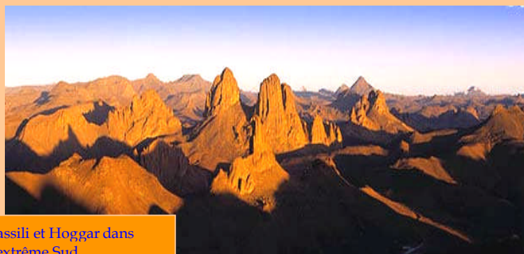
Tassili et Hoggar dans l'extrême Sud