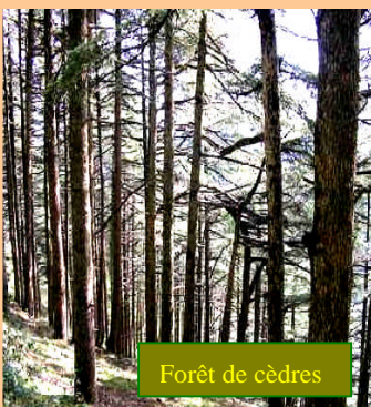
Forêt de cèdres