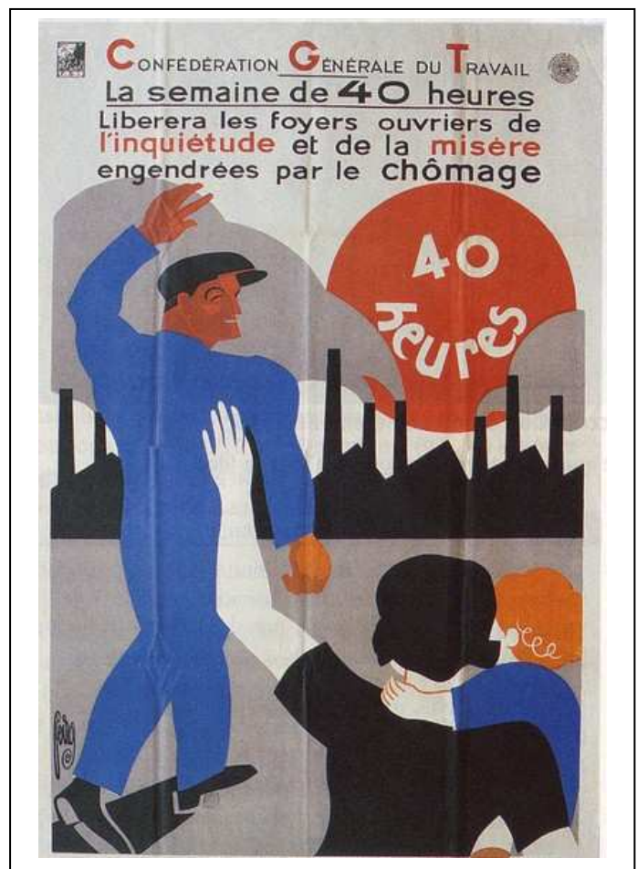
Affiche de Peiros, Biblio.nationale de France, Paris.