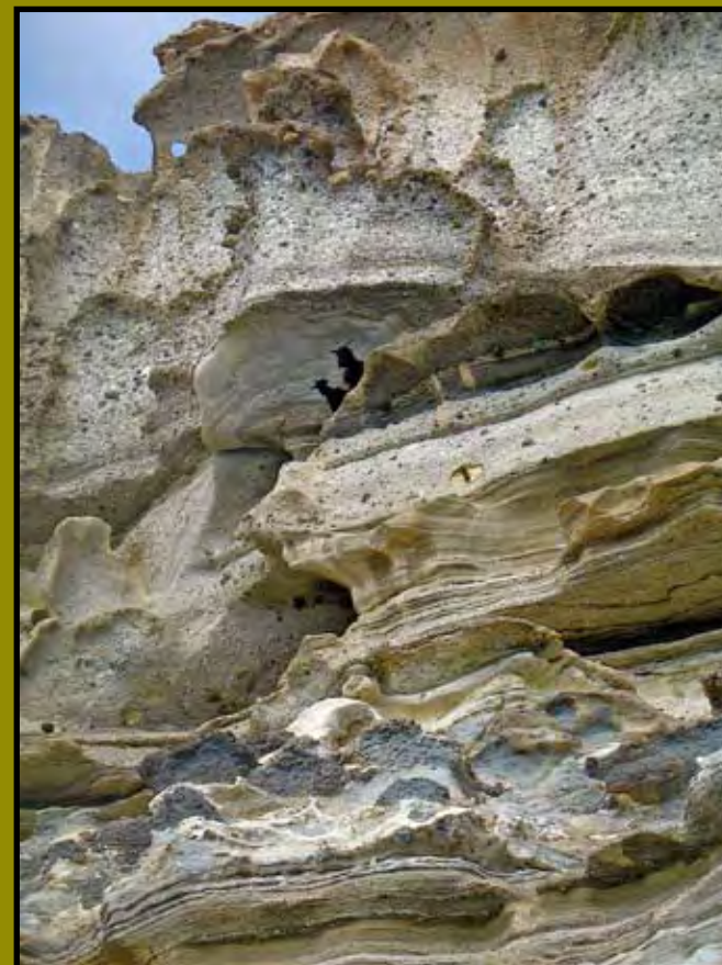
Les gardiennes de Kleftiko: deux chèvres sauvages.