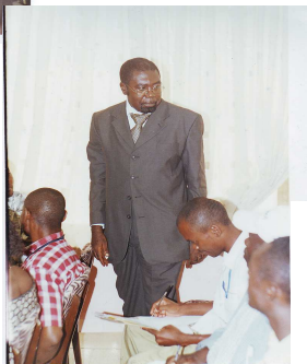
Intervention du secrétaire Technique provincial du PIAASI