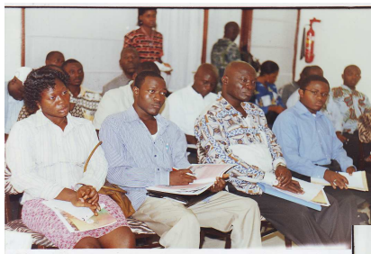
Une vue des médias présents