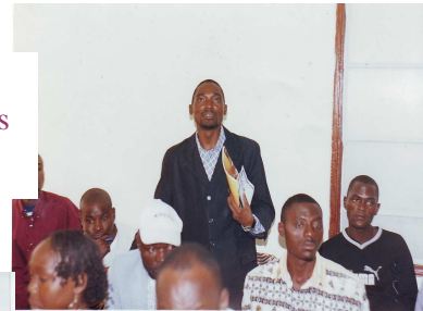
Séance d'échange avec les participants