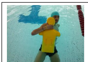
Prise au cou (étranglement)