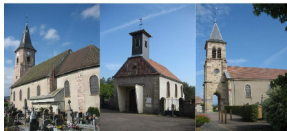
Evette-Salbert - Errevet - Lachapelle sous Chaux - Sermamagny