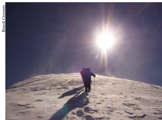
L'arrivée au sommet.