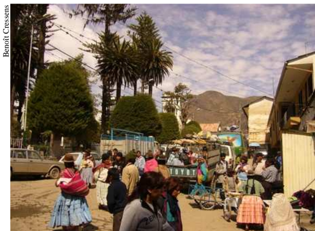
La place centrale de Sorata.

Le 07 juillet , nous organisons notre départ en montagne. Il faut compléter nos provisions et organiser le transport des affaires. La montée de 2400m de dénivelé positif pour atteindre le camp de base de la Laguna Glaciár (5030m) se fait en 2 étapes. Le chemin est praticable pour les mules jusqu'à la Laguna Chilata (4200m). Nous réservons 6 mules pour la première étape et 5 porteurs à partir de la Laguna Chilata pour la deuxième étape.