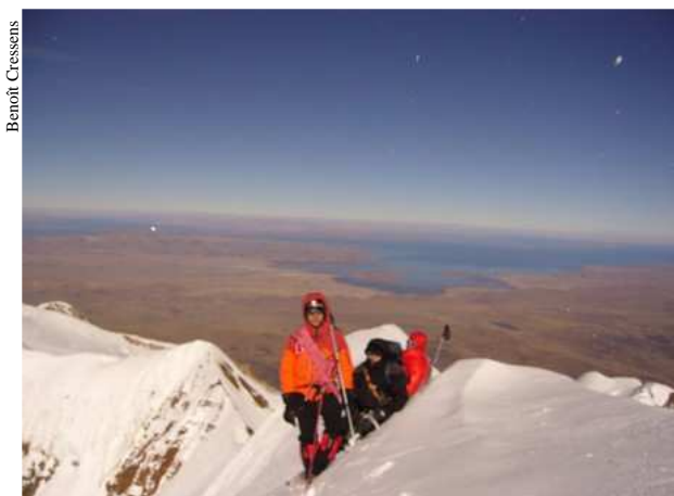
150m sous le sommet. Vue saisissante sur le lac Titicaca.

Le 21 juillet , malgré la fatigue, on repart doucement avec les toulousains au camp de base avancé (5400m) de l'Ancohumá (6427m).