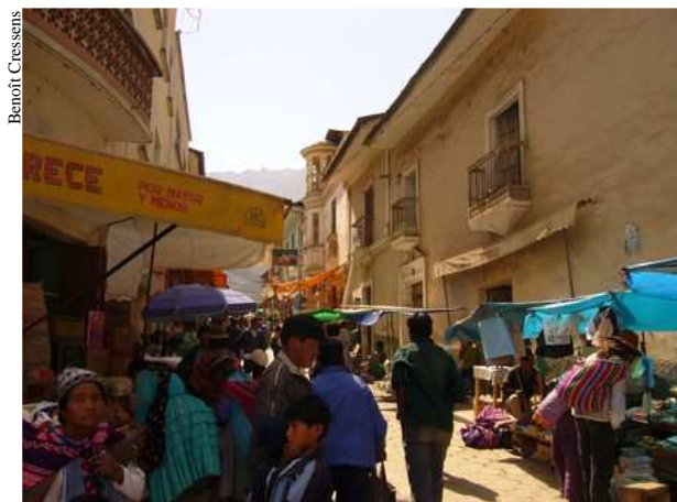
Une des rues commerçantes de Sorata. Un vrai bazar!

La première étape ( 08 juillet ) se déroule sans problème. Nous nous sommes faits arnaquer sur le nombre de mules nécessaires. Il y en a deux en trop. La répartition de la charge est d'ailleurs inégale. La logique bolivienne nous échappe. L'étape se finit sous la neige. Les muletiers déchargent leur bête et redescendent au plus vite tandis que nous montons les tentes sans attendre.