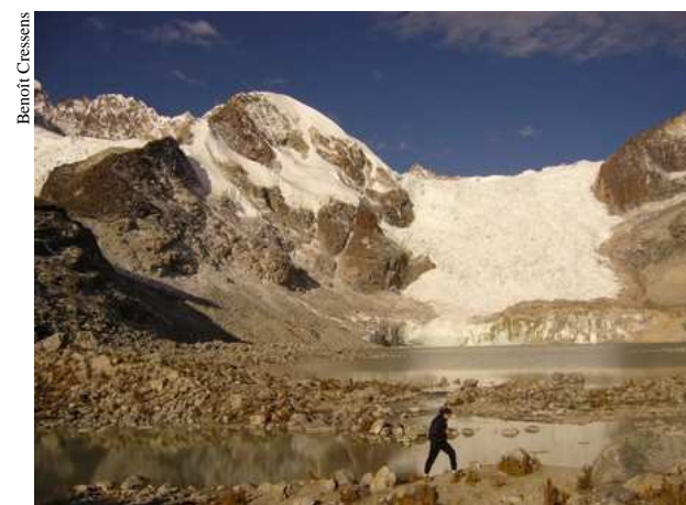
La Laguna Glaciár et le glacier qui l'alimente. A gauche, le sommet sans nom gravi le 11 juillet.