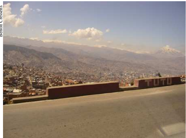
La Paz vue de la route qui monte à El Alto. Au fond l'Illimami (6462m).