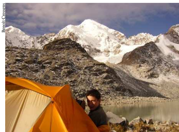
Vincou, le photographe de l'équipe profite des lumières de fin d'après-midi pour mitrailler.

La deuxième étape ( 09 juillet ), bien que plus courte en dénivelé (800m), est beaucoup plus éprouvante. Nous sommes à plus de 4000m avec des charges de 20kg comme les porteurs. D'ailleurs ces derniers cavalaient devant nous. L'étape se finit encore sous la neige, alors que certains porteurs sont chaussés de sandales. Nous sommes maintenant chez nous à la Laguna Glaciár !