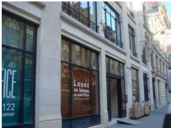
Les nouveaux locaux du CNOMK

Appel au CNOMK de la décision du CROMK contre le refus d'inscription d'un confrère par le CDOMK49 Représentation du Conseil par Jean Yves LEMERLE à Paris