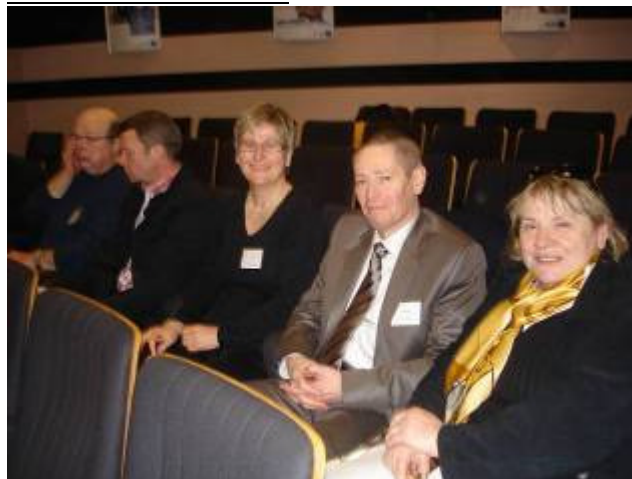
QUERE(53), PAVILLON(44), JOUBERT (49), LEVEQUE (85), GOISNEAU (CRO)

Ordre du jour : Point sur les inscriptions et rappel de la procédure Cotisations Refus d'inscription Radiation Système d'information de l'UE Procédure de suspension en urgence d'un MK RPPS Point sur comptabilité et harmonisation Harmonisations Comptabilité Election régionales Elections chambres disciplinaires Communication interne Code de déontologie Caducées et cartes professionnelles MK intérimaires Plaques et signalétique