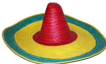
le sombrero (Mexique)