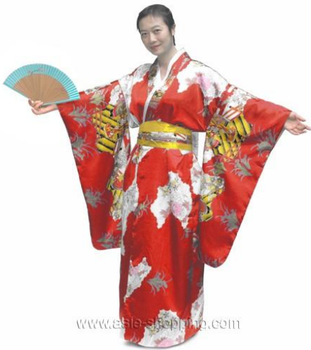
Le kimono et la ceinture obi (Japon)