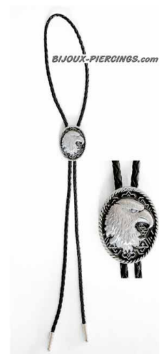
le bolo (Etats-Unis)