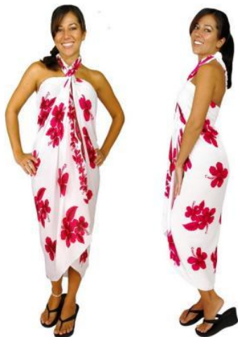
Le paréo (Polynésie)