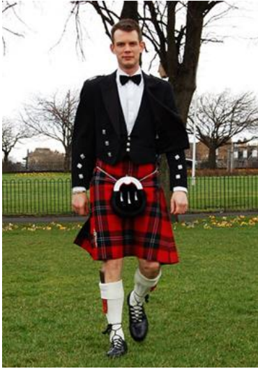
Le kilt (Ecosse)