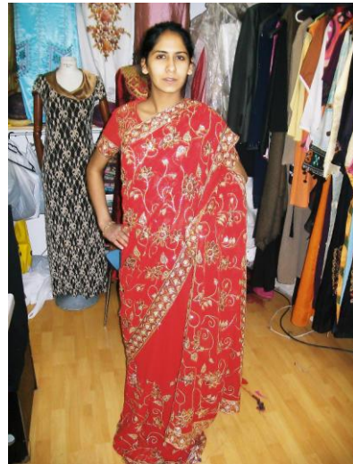
le sari (Inde)