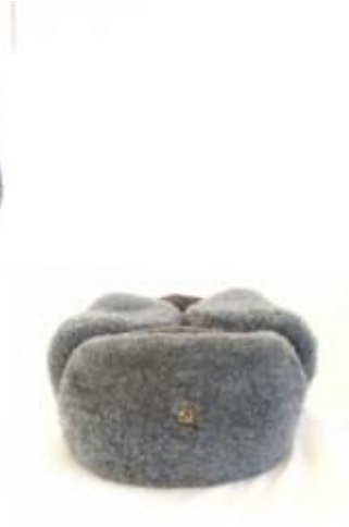
Ouchanka ou chapka (Russie)