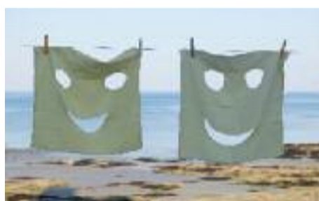
Au fil de l'océan, on y accroche ce que l'on veut...