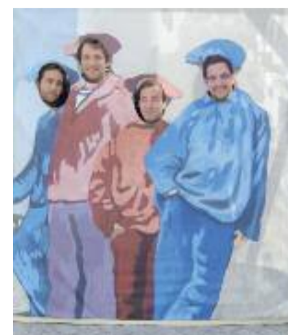
Cherchez l'attrape free-mousse