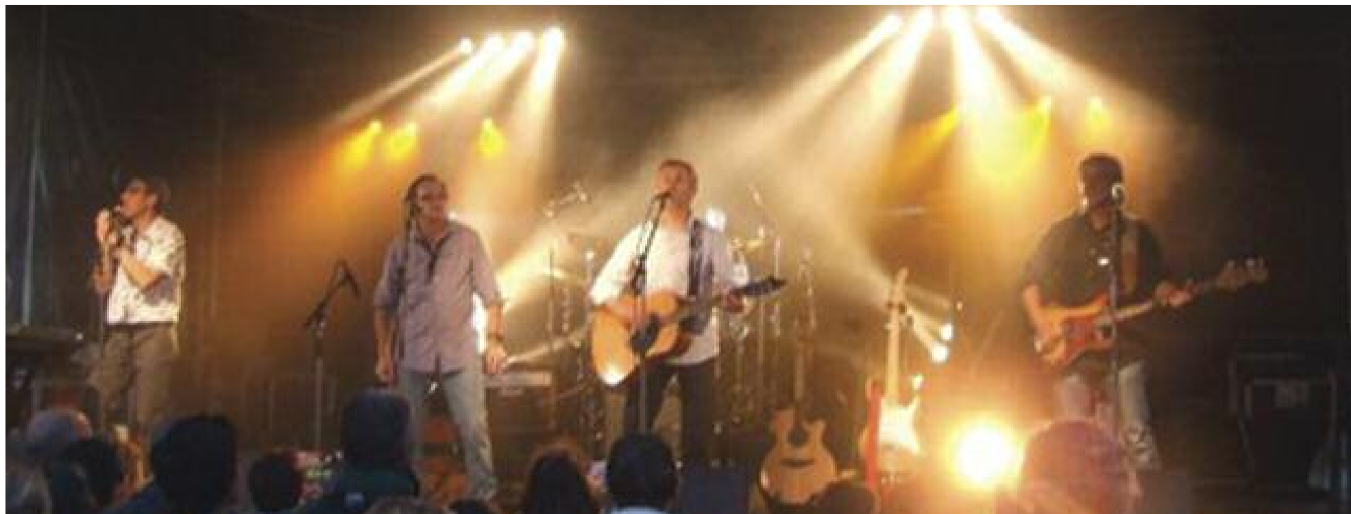
Le Dos de la cuillère