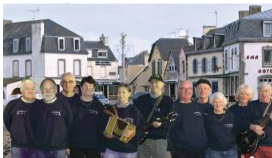
Ar vaskodenn de l'île