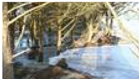
La dune submergée...