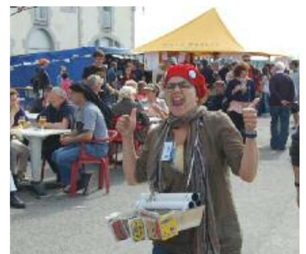
Sur la Cale