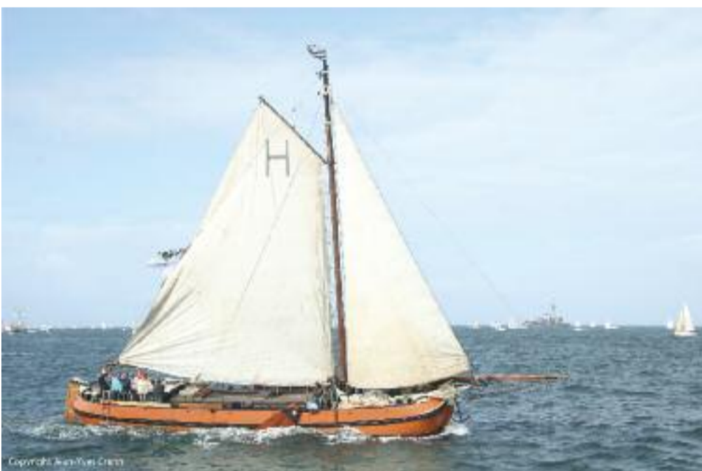
La Korriganez "Hollandaise"