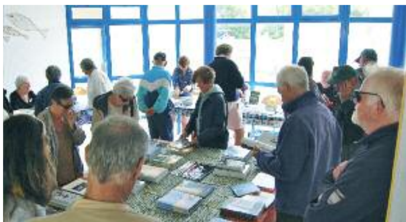
Signature avec des auteurs

CINÉMA DU PORT Lundi à 17h Pêcheur d'Islande (1958), de Pierre Schoendoerffer