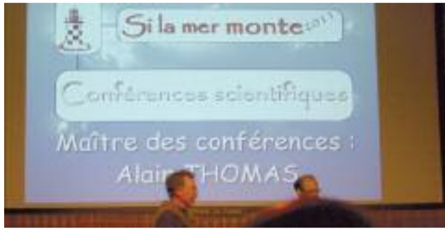
Conférences AU CINÉMA

« Si la mer monte » invite les Pays-Bas au cinéma du port