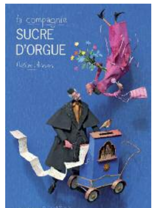
Dans la rue...