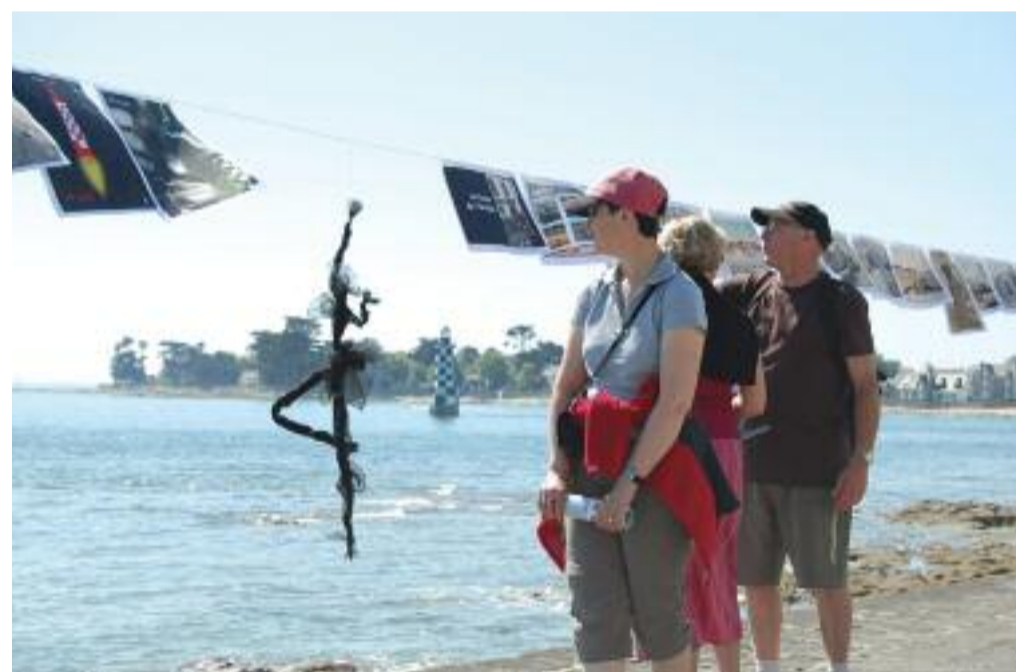
Au fil de l'océan