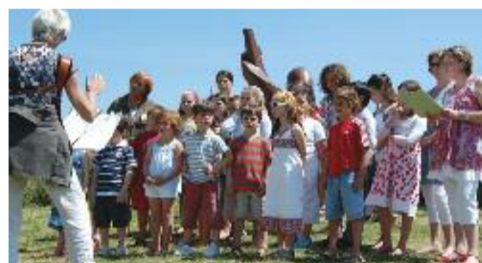
Ouverture avec la chanson Si la mer monte...