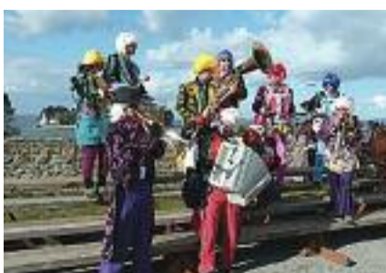
Fanfare des Zingeur's band