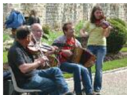
Les bretelles vertes