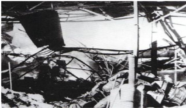
La coopérative d'agrumes de Boufarik (à 25 km au sud-ouest d'Alger) après l'attentat du 1 er novembre.

Document 2 : Communiqué du ministère de l'Intérieur, dirigé par F. Mitterrand, 1 er novembre 1954.