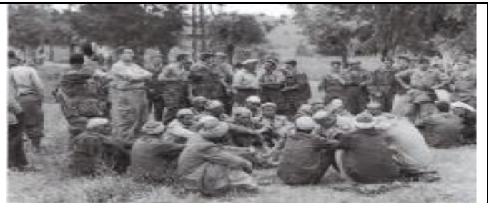
Arrestation d'Algériens après l'embuscade de Palestro, le 8 mai 1956, dans laquelle 17 soldats français ont été tués.

1954 : 1 er novembre, « Toussaint rouge » : le FLN déclenche la lutte armée. 1955 : 1 er avril, l'État d'urgence est proclamé. 1955 : 20 août, reprise de l'insurrection dans le Constantinois. 1956 : mai, l'armée française dispose d'un effectif de 400 000 soldats en Algérie. 1957 : janvier-octobre, « Bataille d'Alger » : ratissage du cœur de la ville pour combattre le FLN. 1958 : 13 mai, formation à Alger d'un « comité de salut public » pour maintenir l'Algérie française. 1958 : 4 juin, De Gaulle à Alger : « Je vous ai compris ». 19 septembre, formation du Gouvernement provisoire de la République algérienne. 1959 : 16 septembre, De Gaulle reconnaît le droit à l'autodétermination des Algériens. 1960 : 24 janvier - 1 er février, semaine des barricades à Alger contre l'autodétermination. 1961 : 23 avril, putsch des généraux contre la « politique d'abandon ». 17 octobre, manifestation organisée par le FLN à Paris, violemment réprimée (plusieurs dizaines de morts) 1962 : 18 mars, signature des accords d'Évian : cessez-le-feu, autodétermination de l'Algérie et coopération franco-algérienne. 3 juillet, proclamation de l'indépendance de l'Algérie.