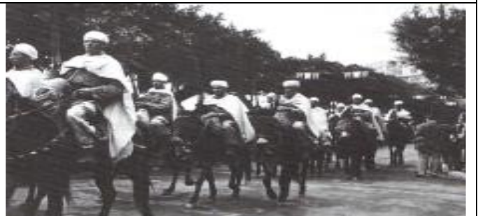
Document 2 : Une harka de harkis, musulmans constituant des unités militaires auxiliaires de l'armée française, défile à Bougie le 11 novembre 1956