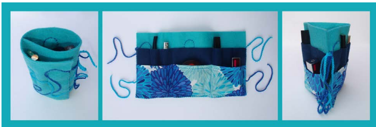
gabarit de la trousse