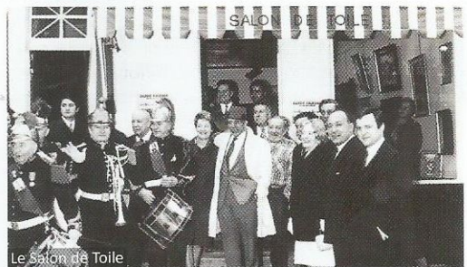
Le Salon de Toile

En vente à la Galerie Roussard 13, rue du Mont-Cenis, 75018 Paris. Séance de dédicace le 28 septembre à partir de 18 heures, à la galerie. Sortie du livre le 29 septembre 2017. Prix : 25 euros