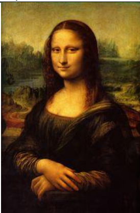
La Joconde, 1517