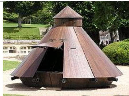
Reproduction au clos Lucé du char de combat de Léonard.